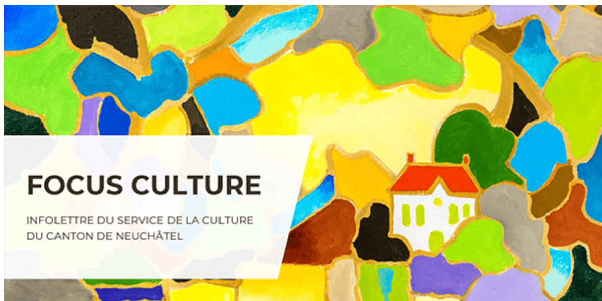
Illustration : Aloys Perregaux, Bords de l'Areuse *