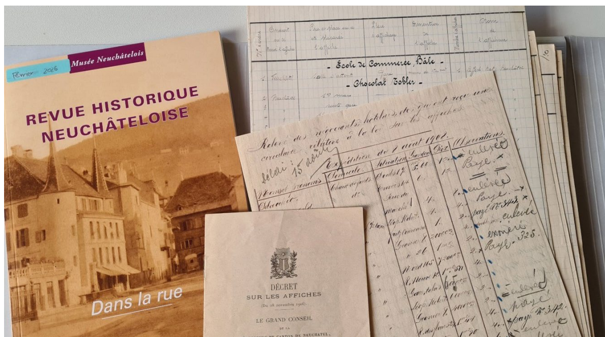
Illustrations : (à gauche) Publication de la Revue historique neuchâteloise ; (à droite) 71A-1 Panneaux publicitaires et affiches 1908-1909.

Des étudiant-e-s de l'Université de Neuchâtel mettent en valeur des fonds d'archives régionaux